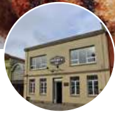
Restobar Bodega 87 21 de Mayo 1469

Restobar Bodega 87, es una nueva y prometedora propuesta nocturna de Punta Arenas. Su particular oferta gastronómica y de coctelería le han otorgado rápidamente un espacio en la bohemia regional ofreciendo tradicionales platos regionales, nacionales e internaciones. Atiende de lunes a jueves de 20 a 1:30 horas y de viernes y sábado de 20 a 2:30 horas. Teléfono 61 2371357